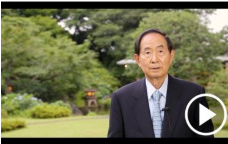
亀井 久興 様 元 国土庁長官

5G・IoT・AI・ブロックチェーンなどの情報通信技術の進歩発達によって社会生活がかなり変わってきました。本当の情報というのは情報通信技術だけで得られるものではなく、人と人が会ってそこで本当の情報が伝わっていくのだらうと思います。単なる”インフォメーション”ではなく”インテリジェンス”というものを考えた時に人が会うということが何より大切だと考えています。ファースト・ウェンズデーは色々な分野で活躍する人が情報交換・意見交換を行い、そのことが仕事に役立つだけではなく社会全体の発展に繋がるだらうと思っております。日本の社会が間違いなく正しい方向に進むためにもファースト・ウェンズデーがますます盛んになることを心から期待しております。